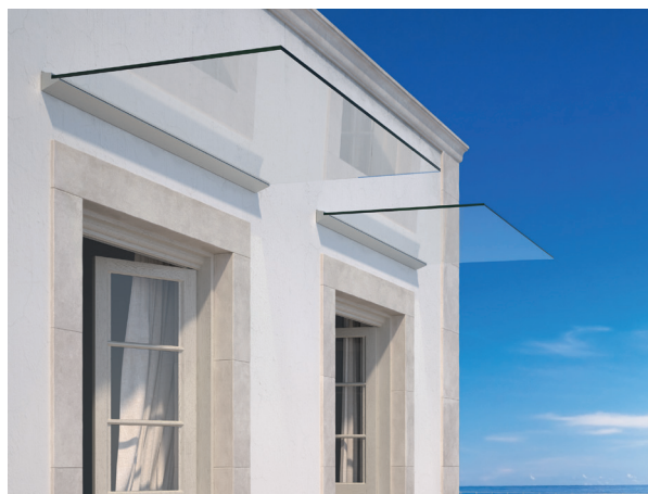
Fixation sur profilé mural

Nous préconisons du verre feuilleté trempé EVA 88.2 ou 88.4 pour ce type de réalisation.