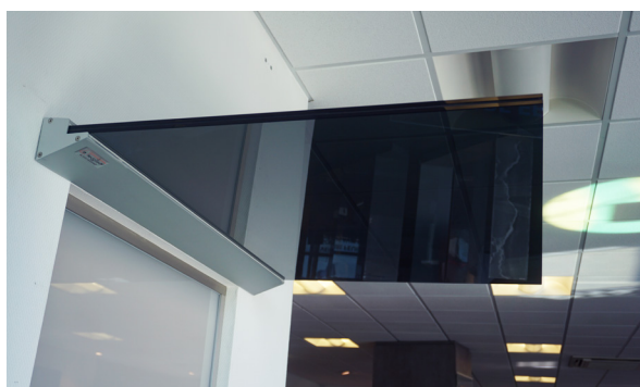
Auvent en verre parsol gris

Ce type de fixation nécessite du verre feuilleté trempé EVA . Ce dernier allie la résistance d'un verre trempé et le maintien des morceaux en cas de casse grâce aux films EVA placés entre les vitrages. Il dispose aussi d'une résistance supplémentaire (chocs physiques et thermiques). Les films EVA hydrophobes lui permettent, par ailleurs, de résister à l'humidité et aux environnements salins.