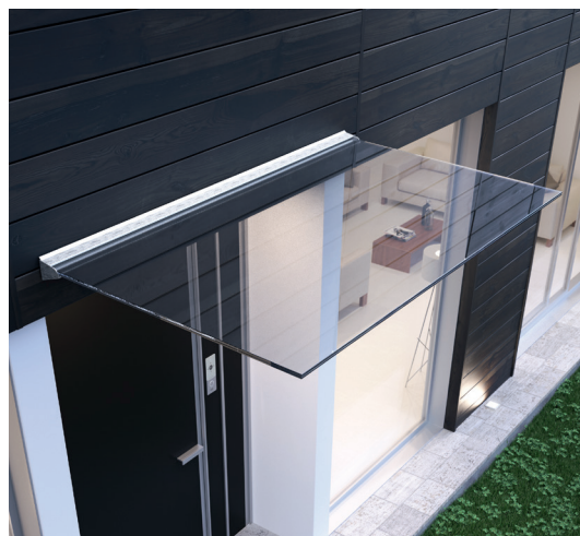
Fixation sur profil

De ce fait, le poseur doit connaître la composition de la façade. Avec l'aide d'un concepteur, il doit également identifier le type d'ancrage idéal ainsi que le porte-à-faux admissible.