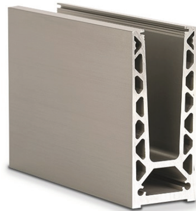
Garde-corps sur profil GARDA 2 F

Economique et simple à poser en neuf ou en rénovation, le garde-corps en verre GARDA 2 F possède un design épuré et élégant, nécessitant peu d'entretien.